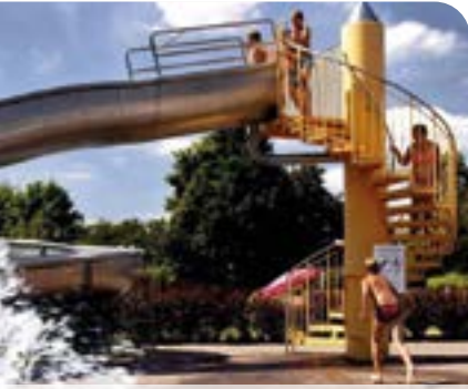
Wurzen startet wieder in die Freibadsaison ▶ Seite 06