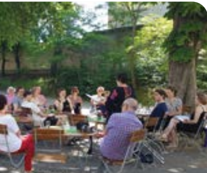
Ringelnetzverein lädt zum Frührschöppchen ▶ Seite 12