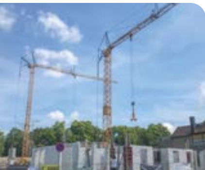
Baustart in Brandis: 20 neue Wohnungen ▶ Seite 18