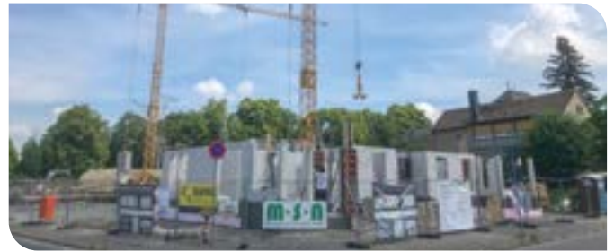
oben: Ausgangszustand vor Baubeginn und aktueller Baustand unten

Wurzener Planungsbüro Weidemüller Verantwortung. Es wird sicher ein Hingucker. Und, es ist seit 1997 der erste Neubau der Wohnungsgenossenschaft Wurzen eG.